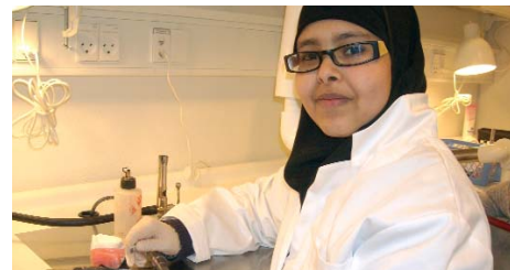
Mulki er ved at blive tandtekniker på Skolen for Klinik-assistenter, Tandplejere og Kliniske Tandteknikere.

Vejledningscentrets frivillige voksne deler deres erfaringer med andre forældre.